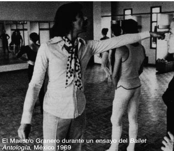
El Maestro Granero durante un ensayo del Ballet Antología , México 1969