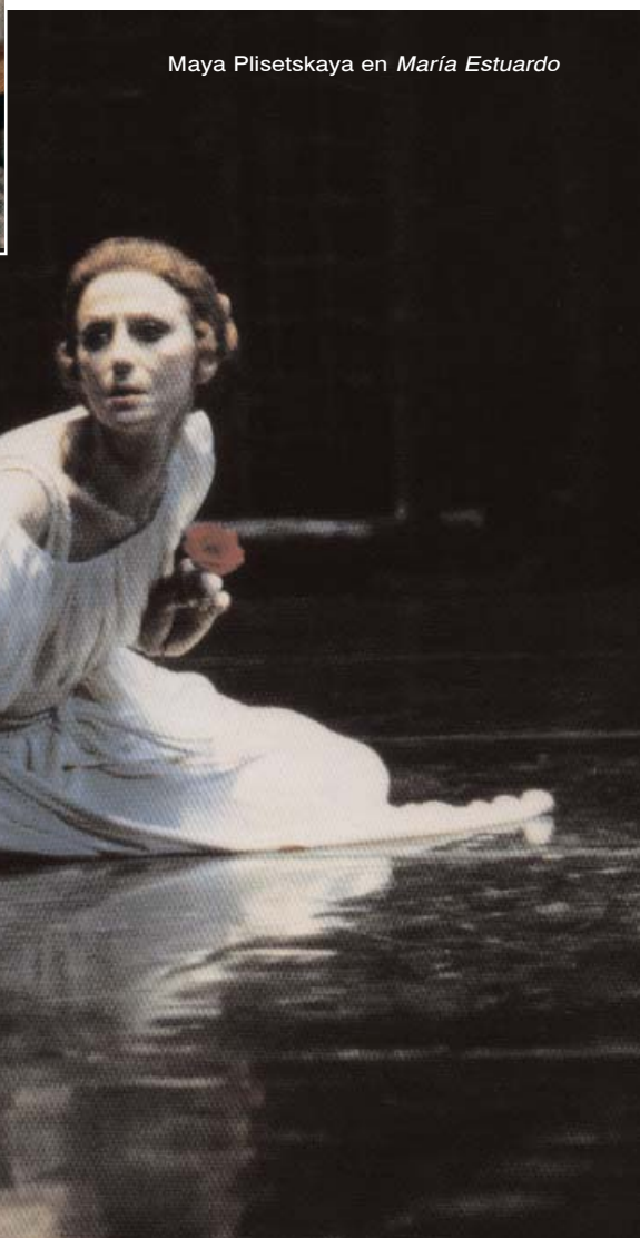
Maya Plisetskaya en María Estuardo