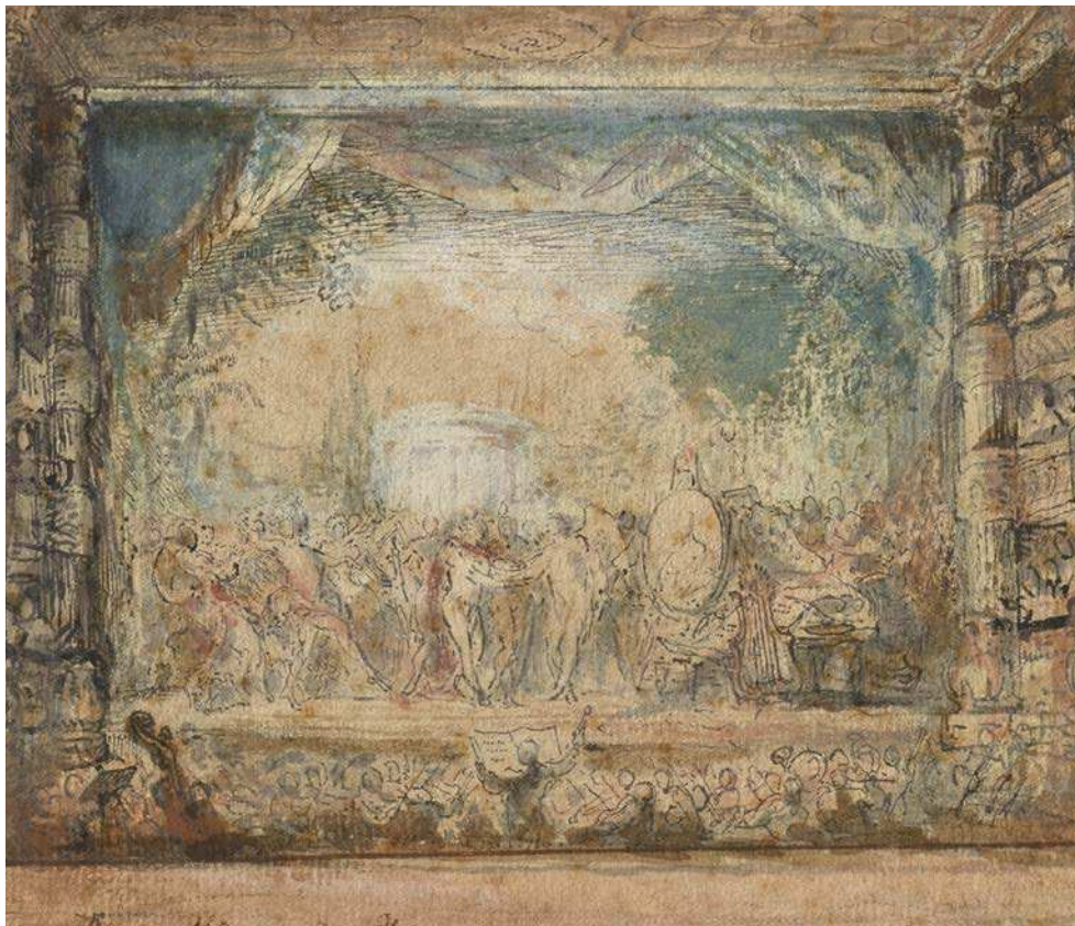
Gabriel de Saint-Aubin, L'Union de l'amour et des arts , [1773 - 1780], pierre noire, plume, aquarelle et rehaut de blanc, BnF, Musique