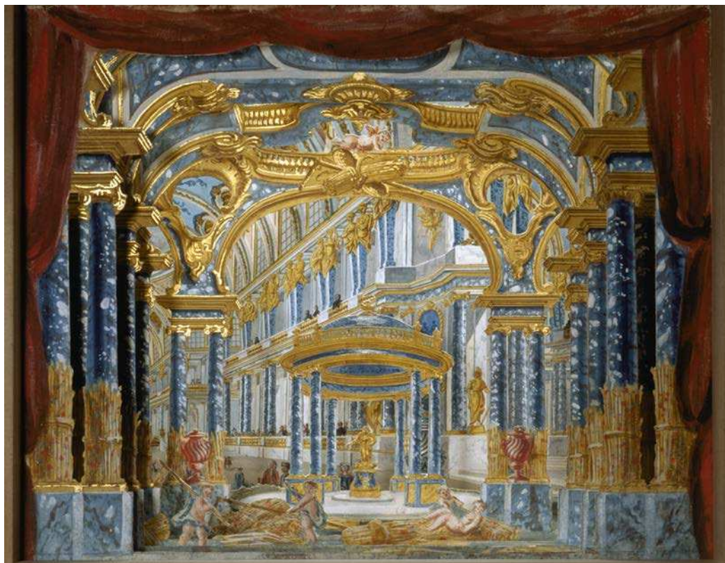
Piero Bonifazio Algieri, Palais de Cérès , maquette de décor en volume pour l'acte I de Proserpine de Lully, 1758, gouache et rehauts d'or, Centre des monuments nationaux