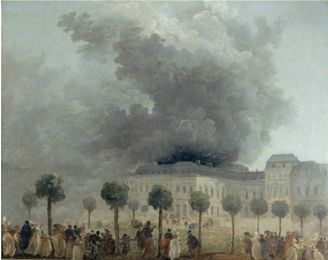
Hubert Robert, L'Incendie de l'Opéra, vu des jardins du Palais-Royal , vers 1781, Musée Carnavalet