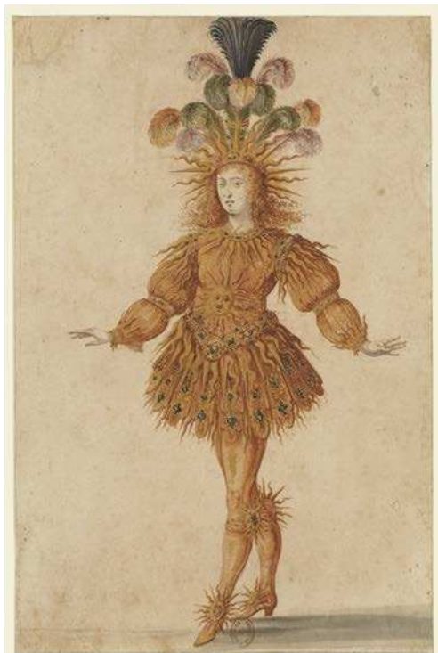
Maître du ballet de la Nuit, Costume pour le Soleil levant dans la dernière entrée du Ballet de la Nuit , 1653, Plume, lavis et gouache rehaussée d'or, BnF, Estampes et photographie

Iconographie disponible dans le cadre de la promotion de l'exposition de la BnF uniquement et pendant la durée de celle-ci. Pour les images provenant des collections BnF, toute publication supérieure à 5 visuels fera l'objet d'une redevance d'utilisation.