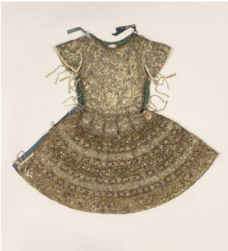
Tailleur des Menus Plaisirs du roi, Costume de ballet pour un danseur, brodé de fils d'or et d'argent, XVII e s., BnF, Musique, Bibliothèque-musée de l'Opéra