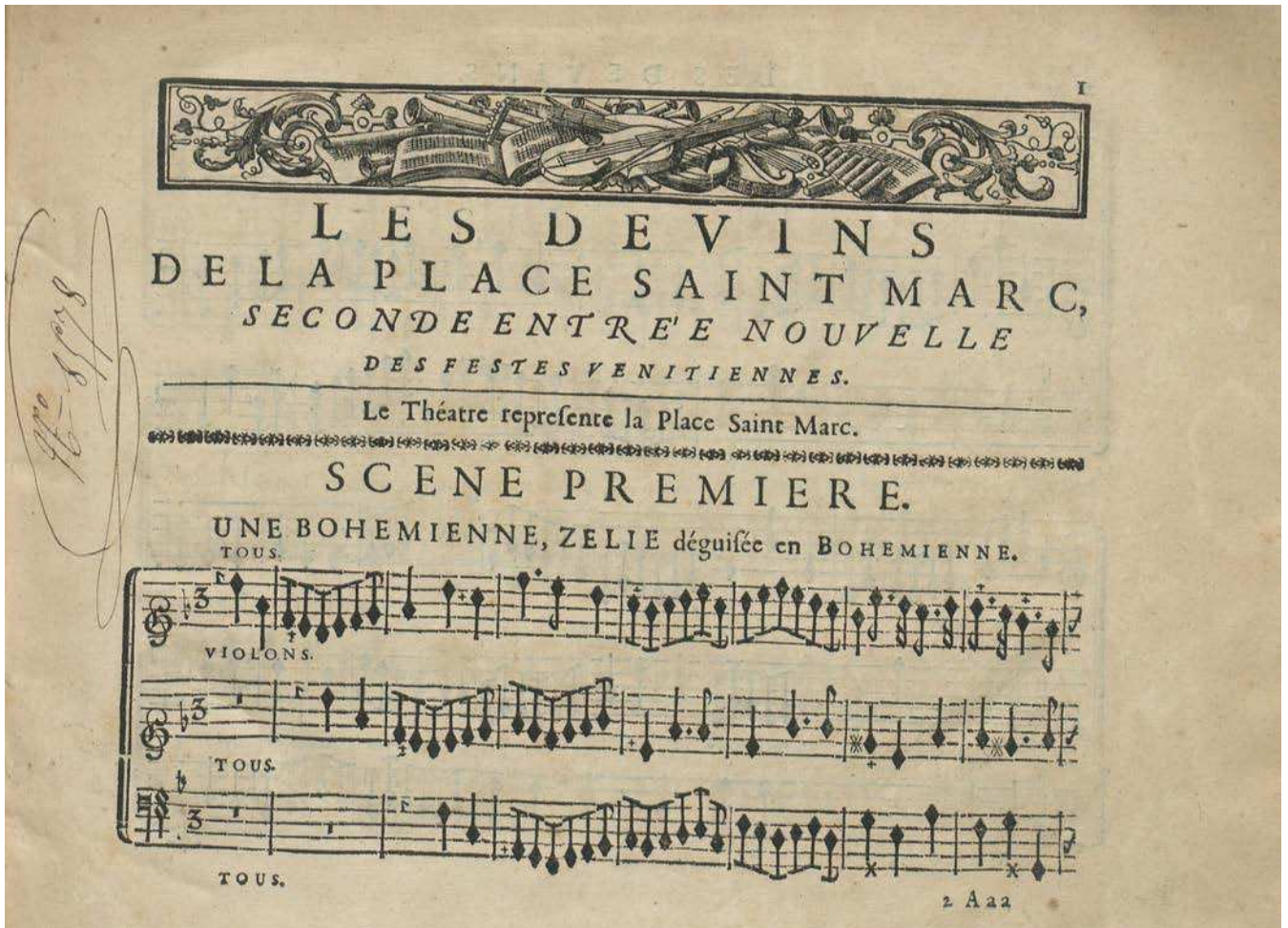
André Campra, Les Devins de la place Saint-Marc , seconde entrée ajoutée aux Fêtes vénitienes , 1710, partition imprimée, BnF, Musique