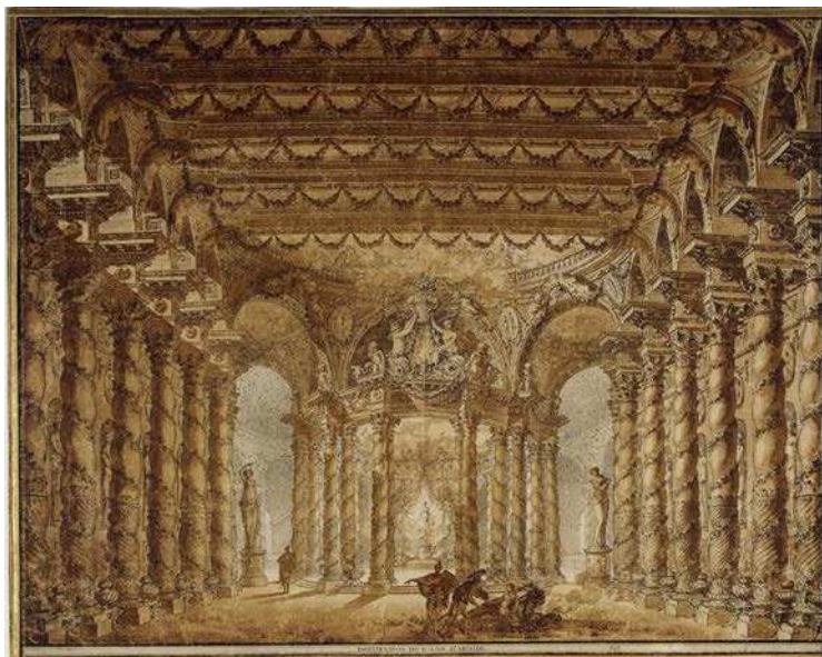
Charles de Wailly, Décoration du Palais d'Armide , 1778, plume et lavis, BnF, Estampes et photographie