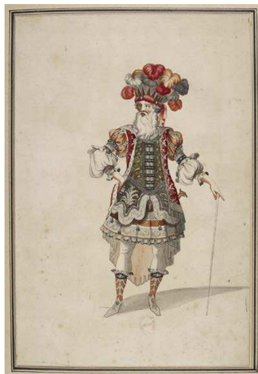
Jean Berain, maquette de costume du roi Égée dans Thésée de Lully, fin XVII e s., gravure aquarellée, BnF, Musique, Bibliothèque-musée de l'Opéra