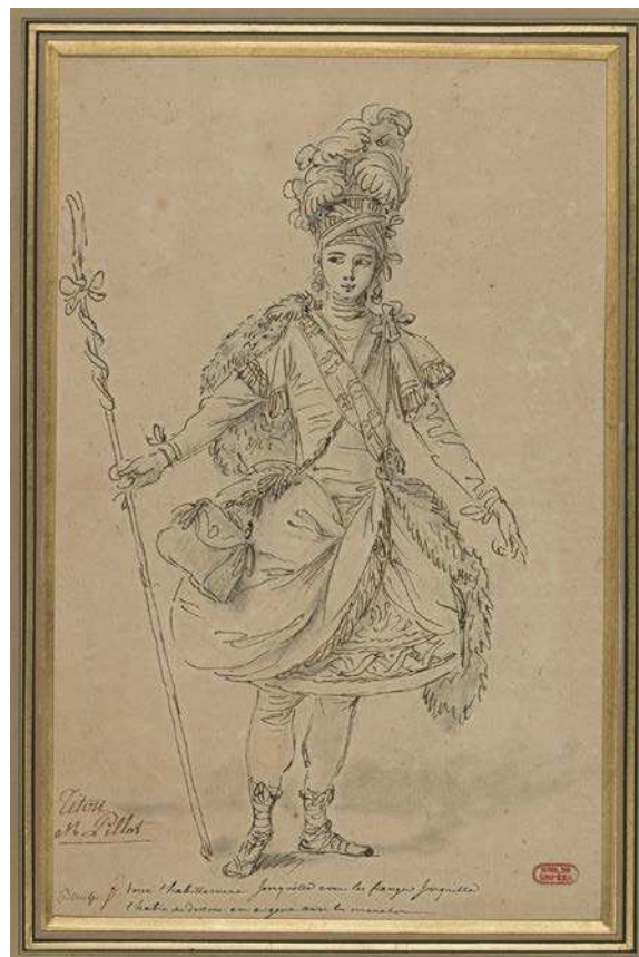
François Boucher, Titon dans Titon et l'Aurore , 1763, dessin, BnF, Musique, Bibliothèque-musée de l'Opéra