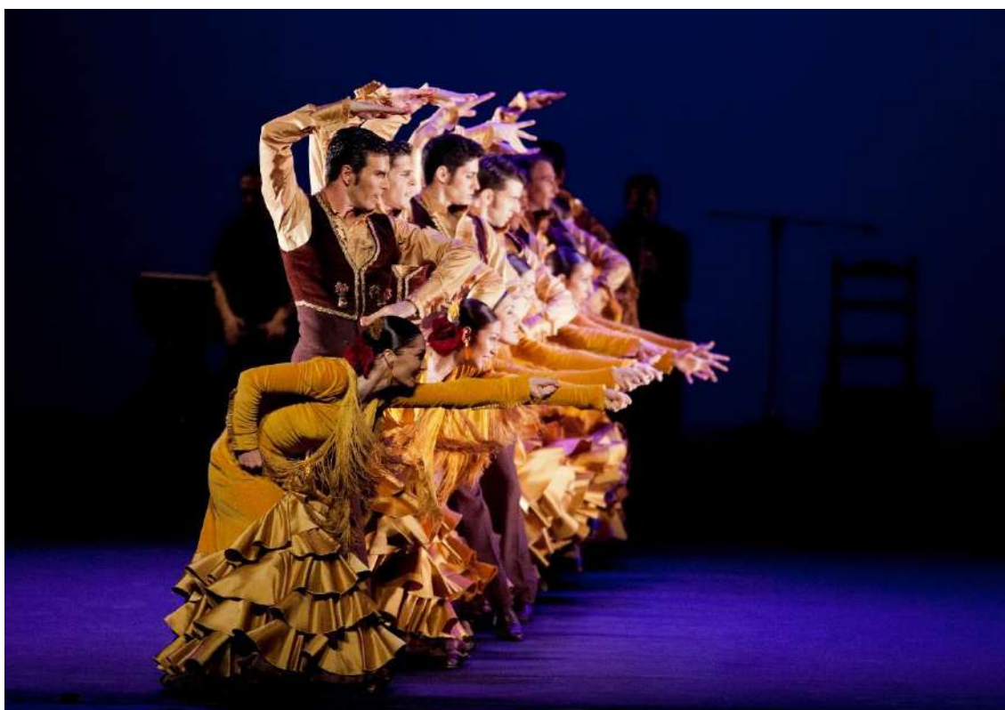
Suite Sevilla

Idea original, Coreografía y puesta en escena: Antonio Najarro