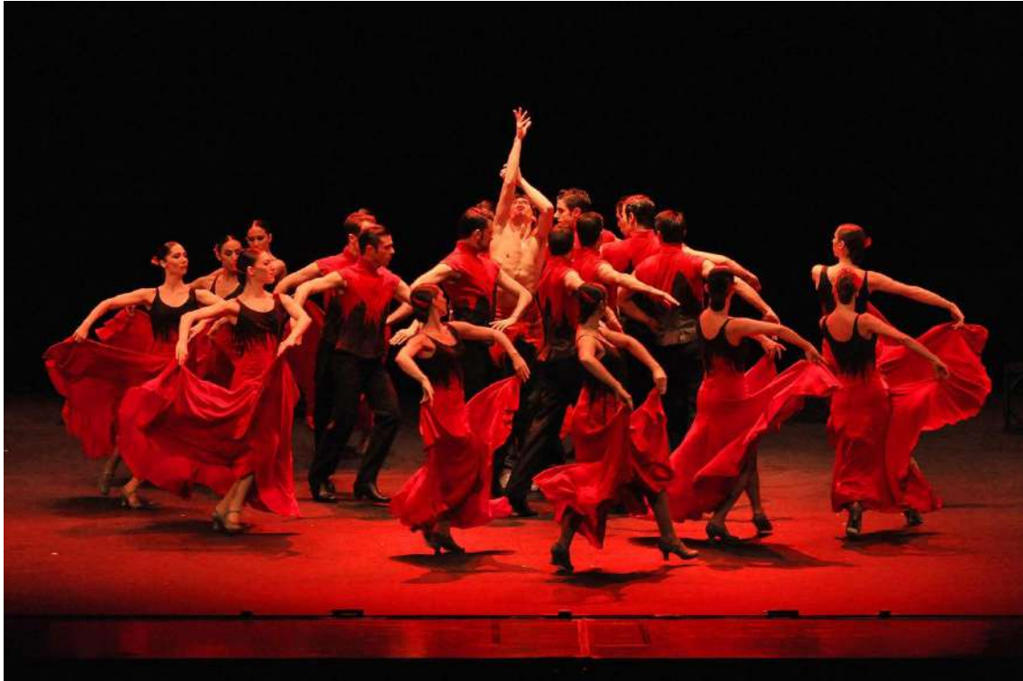
Bolero © Yuki Omori

“A pesar de toda la belleza y la profundidad alcanzada por la versión de Maurice Bejart, creo que con el lenguaje flamenco, con sus ritmos y su estética, es posible dar una nueva lectura, si no más profunda, sí más personal de esta obra enriquecida de una atmósfera y de unos sentimientos nacidos del alma española, de los cuales Ravel fue un profundo observador, atento e inspirado”.