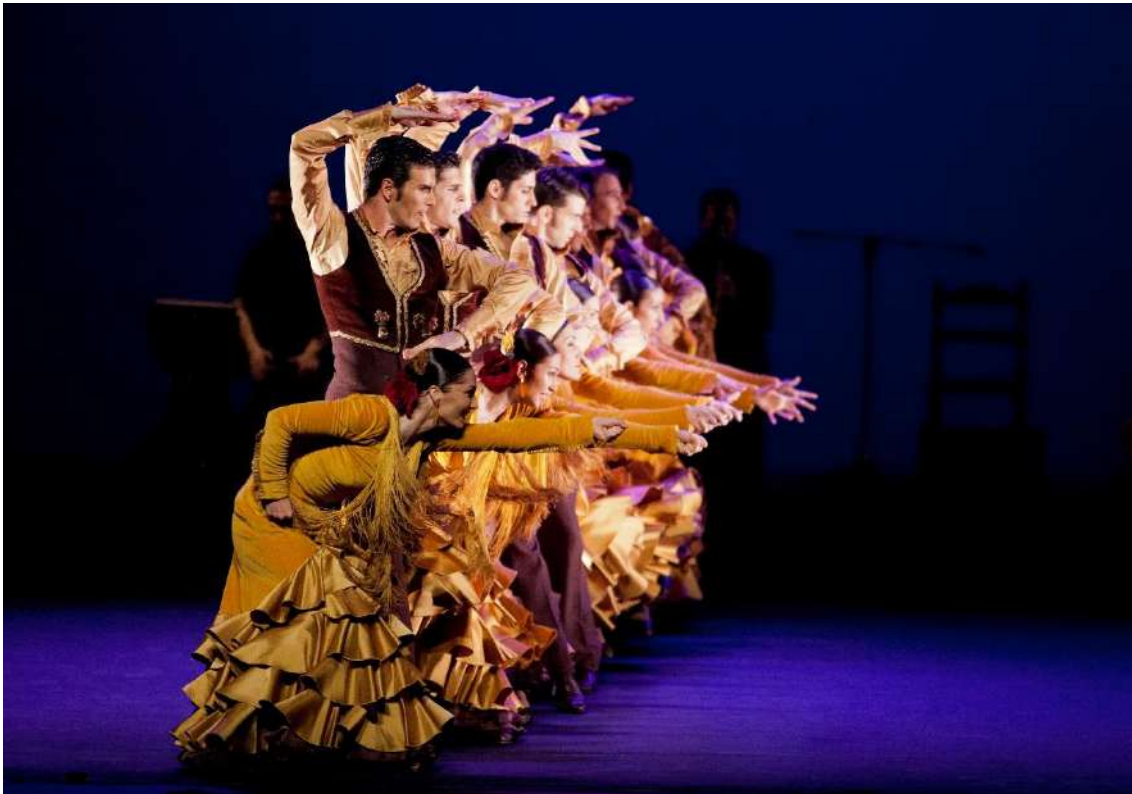
Suite Sevilla

En "Suite Sevilla", Antonio Najarro da vida a una nueva creación coreográfica a través de la Danza Clásico Española fusionada con las nuevas tendencias vanguardistas, tanto musicales como dancísticas, de este arte con un lenguaje que caracteriza y rige su estilo personal como creador.