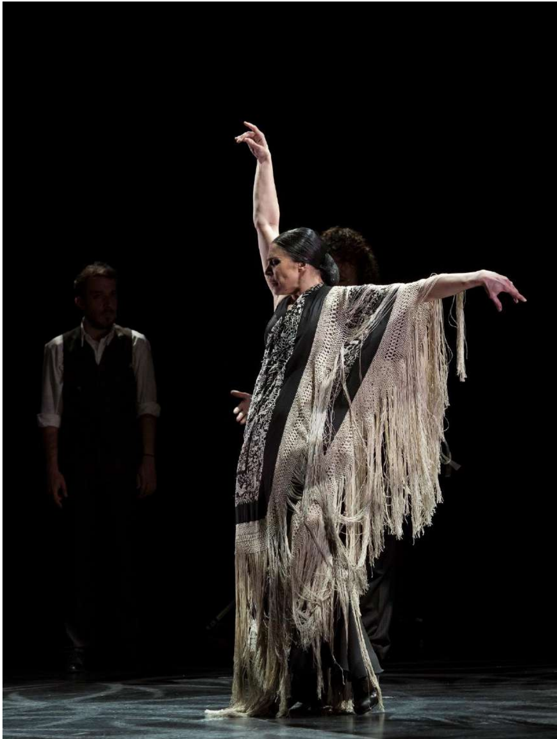
Soleá del Mantón