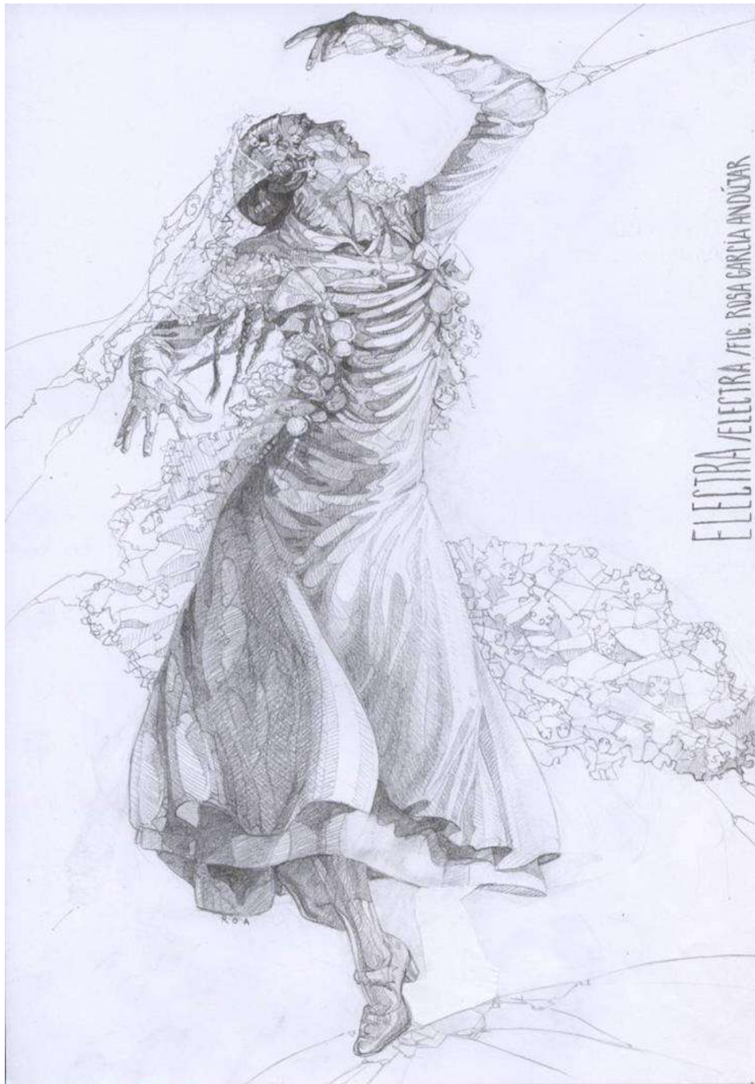
© Figurín de Electra por Rosa García Andujar, diseñadora del vestuario de Electra .