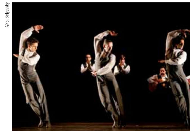
BALLET NACIONAL DE ESPAÑA. Farruca