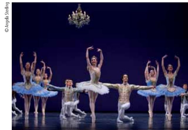
BALLET NACIONAL DE HOLANDA (HET). Theme and Variations