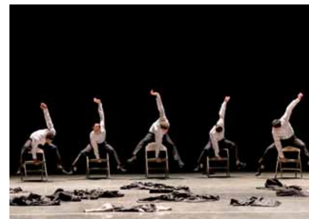
SILICON VALLEY BALLET. Minus 16