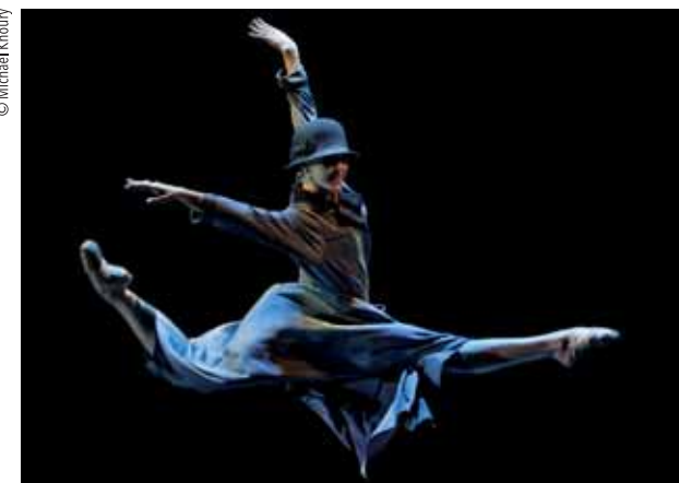
EIFMAN BALLET DE SAN PETERSBURGO. Rodin